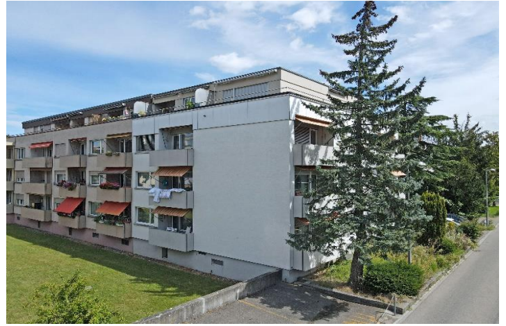
Bern BE, Untermattweg 56 (11 Wohnungen)