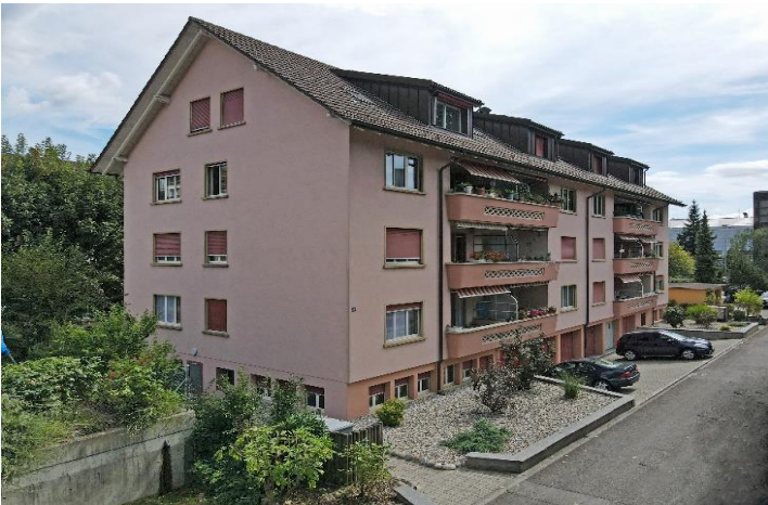
Biel BE, Bözingenstrasse 26 b+c (18 Wohnungen)