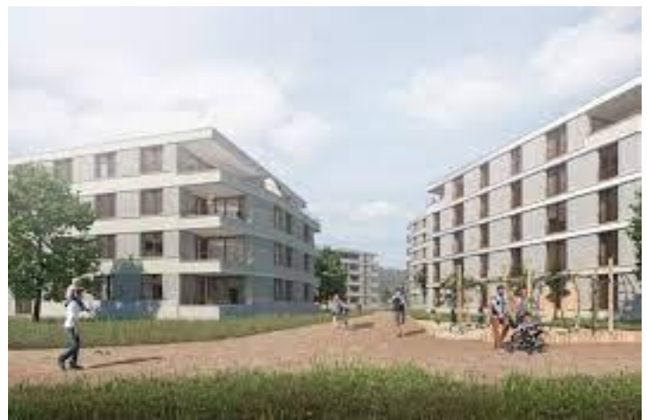
Kaufrecht Marly FR, Les Moulins (55 Wohnungen)