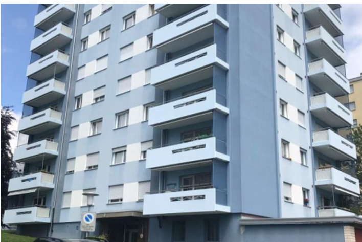
Freiburg FR, Route Joseph-Chaley 13-15 (96 Wohnungen)