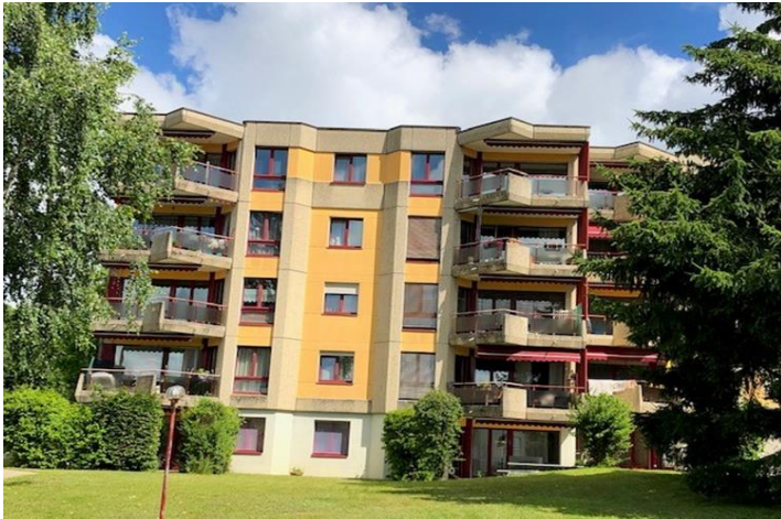
Villars-sur-Glâne FR, Route du Bugnon 11-13 (20 Wohnungen)