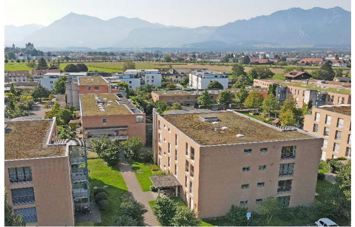
Steffisburg BE, Bahnhofstrasse 29 (12 Wohnungen)