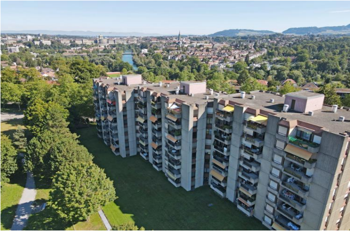
Köniz BE, Bondelistrasse 50 - 54 (96 Wohnungen)