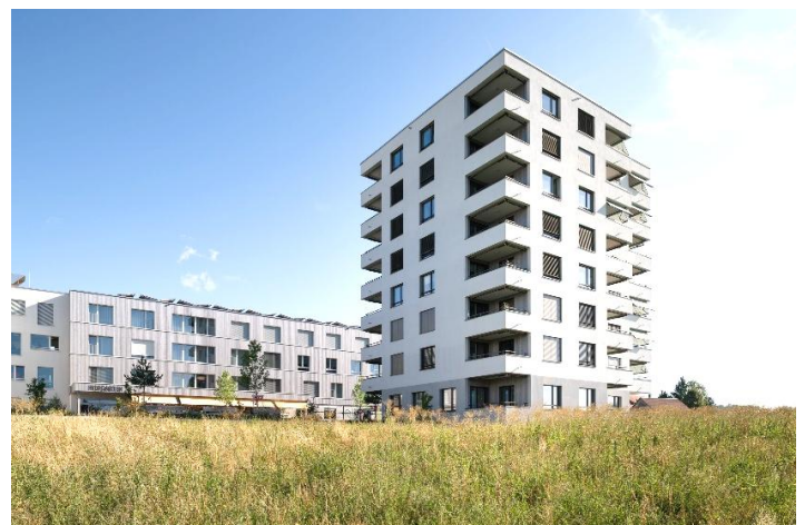
Bellach SO, Grederstrasse 66