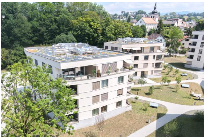
Marly FR, Les Moulins