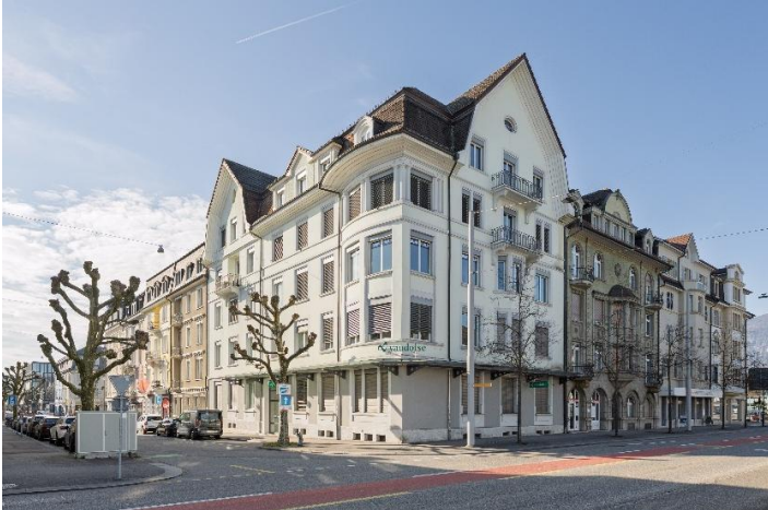
Solothurn SO, Niklaus-Konrad-Strasse 25+27