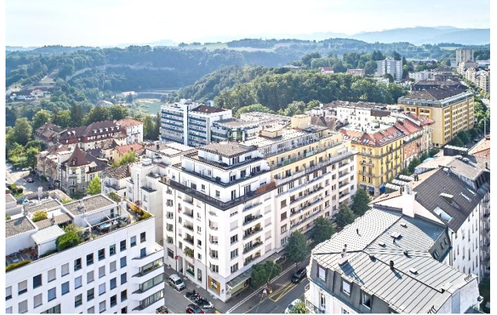
Freiburg FR, Boulevard de Pérolles 20