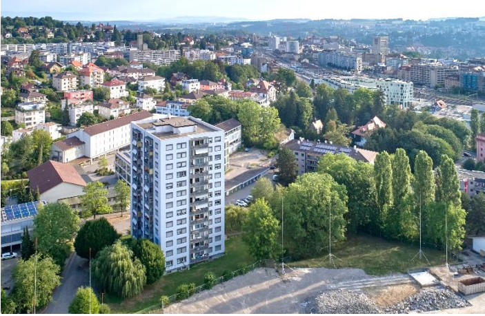
Freiburg FR, Route du Châtelet 8