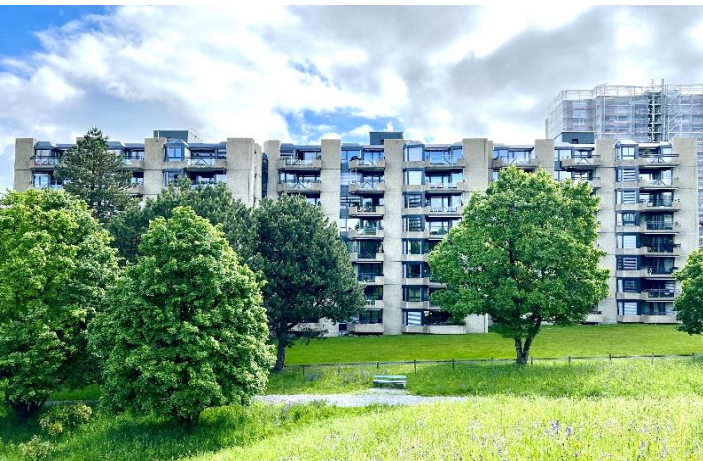
Köniz BE, Bondelistrasse 50-54