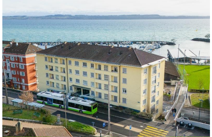
Neuchâtel NE, Rue des Saars 2