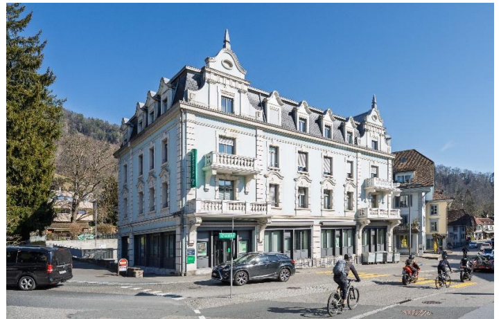
Thun BE, Hofstettenstrasse 1